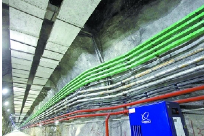
通往大亚湾中微子实验厅的隧道。

(1)新闻背景: 3月8日下午, 大亚湾反应堆中微子实验国际合作组中方发言人、中国科学院高能物理研究所所长王贻芳研究员向全世界宣布: 大亚湾实验以 5.2 倍标准偏差的置信度 ( >99.9999\% ) 测得中微子混合角 \theta_{13} 不为零, 首次实验发现了中微子的第三种振荡模式。由于这一方案具有独特的地理优势和独到的设计, 得到了国际上的广泛支持, 目前汇集了来自中国大陆、美国、俄罗斯、捷克、中国香港和中国台湾等 6 个国家和地区的 200 多名科学家共同参与。据介绍, 大亚湾实验是一个中微子“消失”的实验, 它通过分布在三个实验大厅的 8 个全同的探测器来获取数据。每个探测器为直径 5 米、高 5 米的圆柱形, 装满透明的液体闪烁体, 总重 110 吨。周围紧邻的核反应堆产生海量的电子反中微子, 近点实验大厅中的探测器将会测量这些中微子的初始通量, 而远点实验大厅的探测器将负责寻找预期中的通量减少。在 2011 年 12 月 24 日至 2012 年 2 月 17 日的实验中, 科研人员使用了 6 个中微子探测器, 完成了实验数据的获取、质量检查、刻度、修正和数据分析。结果表明中微子第三种振荡几率为 9.2%, 误差为 1.7%, 从而首次发现了这种新的中微子振荡模式。这项来自中国的物理学发现在世界上引起了轰动, 在不到一天的时间里, 即有 1000 多条海外网络报道和评论, 掀起了一股中微子的热潮。