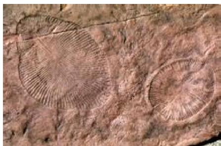
Figure 2. 狄更逊水母(Dickinsonia)化石

地质学家于 1946 年在澳洲埃迪亚加拉山的赤红岩层中发现了最古老的大型多细胞化石，其生存年限早于寒武纪进化大爆炸（Cambrian evolutionary explosion），先前的研究表明正是在该时期产生了类似于这些化石的现代动物群化石。这些化石要追溯到至今 5.42 亿至 6.35 亿年前的埃迪卡拉纪(Ediacaran)时期，其中有狄更逊水母(Dickinsonia)化石(Figure 2)等。埃迪亚加拉纪化石代表了一种独立的陆地生命进化辐射模式，这种模式要比寒武纪进化大爆炸出现的海洋生物至少早 2000 万年。长期以来，远古时期的多细胞化石被认为是早期海洋生物的祖先，它们生活在海洋里，是一些陆栖地衣或其他微生物菌群的残留部分。但最新的化石研究发现，这些远古时期的多细胞生物与陆生生物具有共性，所以它们很可能是生活在陆地上的，而非海洋里。